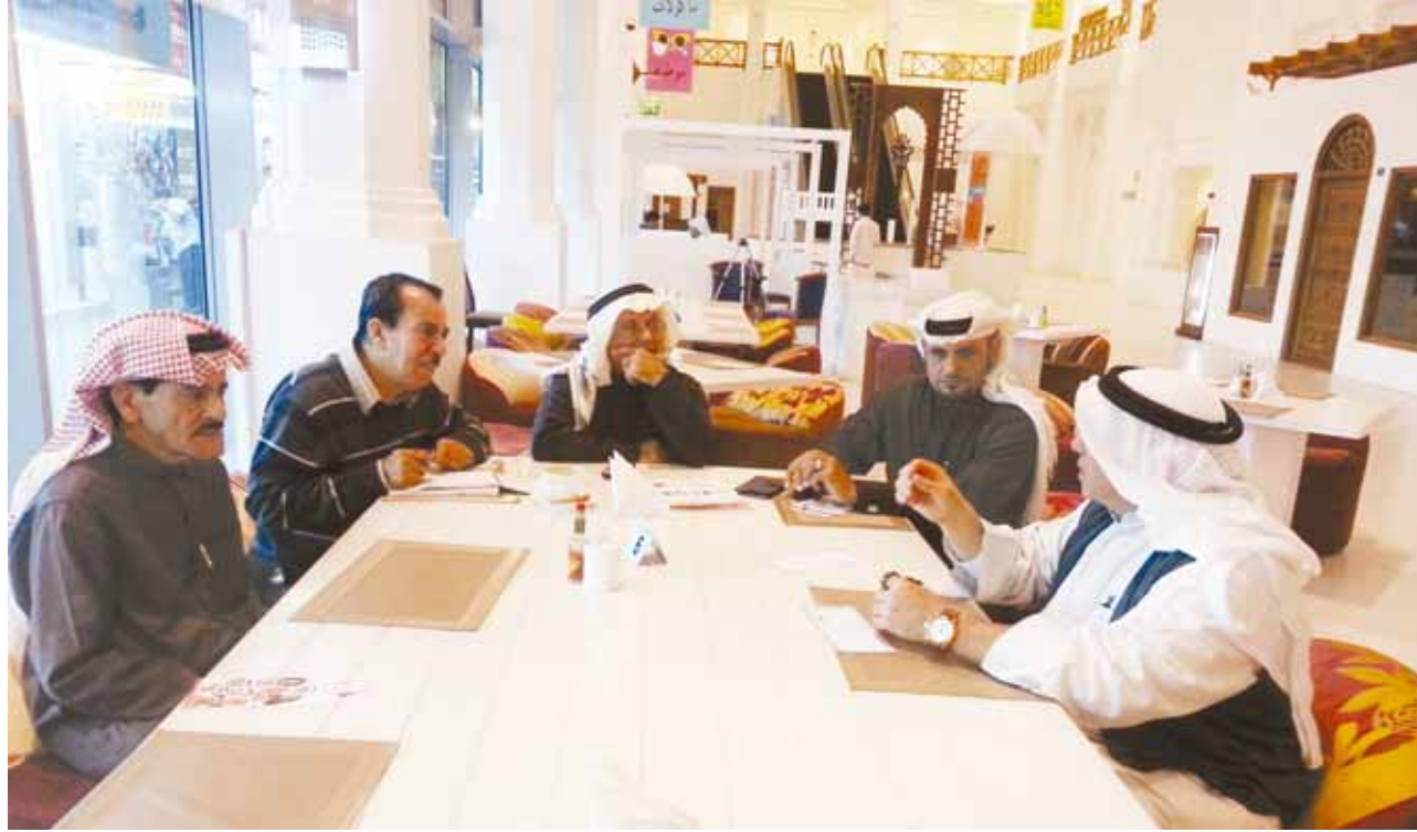
○ أخبار الخليج: تلتقي بعدد من تجار سوق المنامة.

عقد عدد من تجار سوق المنامة لقاءً بالسادسة مساء أمس الأول بهدف تأسيس (جمعية للأسواق الشعبية) كمرحلة انتقالية تتجاوز فيها اللجنة الأهلية لتطوير سوق المنامة إلى جمعية شاملة لكل الأسواق الشعبية مع توافق ساد أجواء اللقاء بضرورة الإسراع بانطلاق الجمعية في الأيام القليلة القادمة. بدأ اللقاء بعدد قليل من التجار وأصحاب المحلات بمقهى باب البحرين ثم التقوا بعد أكبر بمقهى مجمع سوق الذهب القديم حين علموا بان اللقاء قد حدد في مهدي مجمع سوق الذهب، فانتقلوا إلى هناك بالسابعة مساء أمس الأول ليعلموا فيه انطلاقاً جديدة للجمعية بعد تدارسهم اللائحة الداخلية لها ورفع هذا التصور إلى الجهات المعنية صباحاً غد للموافقة على انطلاقتها. وقد التقت «أخبار الخليج»