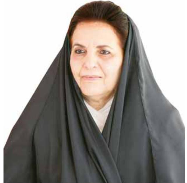
سمو الأميرة سبيكة بنت إبراهيم آل خليفة.

يهدف تحقيق أهداف عدة يجعل البحرين مركزا للأسر المنتجة والصناعات التقليدية المتطورة، وتنمية المجتمع عن طريق دعم العمل والإنتاج، وزيادة أعداد الأسر المنتجة، ونشر مفهوم التوظيف الذاتي، وتنمية روح الريادة والعمل الخاص، إلى جانب زيادة قاعدة الجمعيات الأهلية التي تقدم الخدمات للأسر المنتجة والصناعات الحرفية، ويعد مشروع المنزل المنتج فرصة لتخصيص مستوى الأسر اقتصاديا، وتحويلهم من أسر محدودة الدخل إلى أسر منتجة، وتأهيل الشباب وإكسابهم مهارات فنية وحرفية، وإتاحة الفرصة أمامهم للإنتاج وتنمية الإتجاه والسلوك الإنتاجي كقيمة اجتماعية لدى الأسر والأفراد المنزّل المسمّى «المنزّل المنتج» يهدف المساهمة في بيان ووضع المعايير والضوابط التي توجه سلوك الأفراد لتحقيق الرفاهية الشاملة للفرد والجماعات بما يحقق النمو والاستقرار الاجتماعي والاقتصادي لها، وذلك بالتعاون والتشبيك مع المؤسسات ذات الصلة الحكومية والأهلية منها، والاستفادة من الخبرات الدولية المتخصصة عبر توقيع الاتفاقيات مع الجهات التي تمتلك الخبرة في هذا المجال. وتعظيم مفاهيم التنمية بالمشاركة مع القطاع الخاص، ودعم وتطوير الصناعات التقليدية، والحفاظ عليها من الاندثار عبر دعم التنافسية لديها، وزيادة فاعلية الخدمات عبر التشبيك بين الوزارات والمؤسسات التي تتعامل مع الأسر المنتجة، وأخيرا تنمية وتطوير البنية الأساسية والغطاء القانوني لمشروعات الأسر المنتجة.