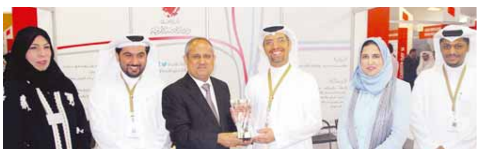
احتفال يوم المهن.

الدور الكبير الذي توليه الاتفاقية للتدريب العملي أثناء وبعد التخرج كي يكون الطلاب مؤهلين لسوق العمل وعلى أعلى المستويات العالمية من المهنية. وتهدف المذكرة التي تعكس التعاون بين الأطراف الثلاثة إلى تدريب الطلبة ودعمهم في مجال الضيافة وإدارة الأعمال السياحية وهي مرتبطة بالقطاع ومن هنا وتأهيلهم أكاديمياً وعملياً لرفع مستوى المشاركة على الصعيد المهني بما يؤهلهم للحصول على وظائف ذات جودة عالية ورواتب مرموقة. المساعد للسياحة بأن المذكرة تأتي في إطار البرامج الاستراتيجية التي وضعتها قطاع السياحة لدعم مشاركة البحرينيين في القطاع السياحي بهدف تمكين العدد الأكبر في إطار استراتيجيتها الرامية إلى تطوير القطاع السياحي وإعداد بحرينيين أكفاء في مجال الضيافة وإدارة الفعاليات، وقعت وزارة الثقافة المتمثلة بقطاع السياحة على مذكرة تفاهم مع كل من بوليتكنك البحرين وجامعة Haaga - Heilia الفنلندية للعلوم التطبيقية بمقر بوليتكنك البحرين، قام بتوقيع المذكرة من جانب وزارة الثقافة الشيخ خالد بن حمود آل خليفة الوكيل المساعد للسياحة، ومن جانب بوليتكنك البحرين الدكتور محمد إبراهيم العسيري القائم بأعمال الرئيس التنفيذي ومن جانب الجامعة الفنلندية السيد لارس التليك مدير العلاقات الدولية بالجامعة. عقب التوقيع صرح الوكيل