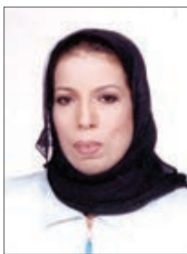
□ دكتورة هيا النعيمي

صرحت الدكتورة هيا بنت علي بن حسن النعيمي نائبة الرئيسة لخدمة المجتمع وشؤون الخريجين بتنظيم مركز خدمة المجتمع والتعليم المستمر في جامعة البحرين مؤخراً ورشة عمل بعنوان «المالية