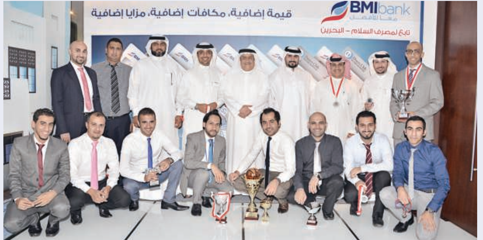
موظفو البنك في ختام دورة الألعاب الرمضانية

من ناحية أخرى، قام ساتر بتسليم فريق كرة القدم في البنك شهادات تقدير لحصولهم على المركز الثالث في بطولة كرة القدم لمركز البحرين التجاري العالمي التي تم تنظيمها للمستأجرين.