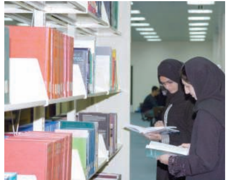
مكتبات جامعة البحرين توفر لجمهور المنتسبين إلى الجامعة المعلومات لمساندة برامج التدريس والبحث العلمي