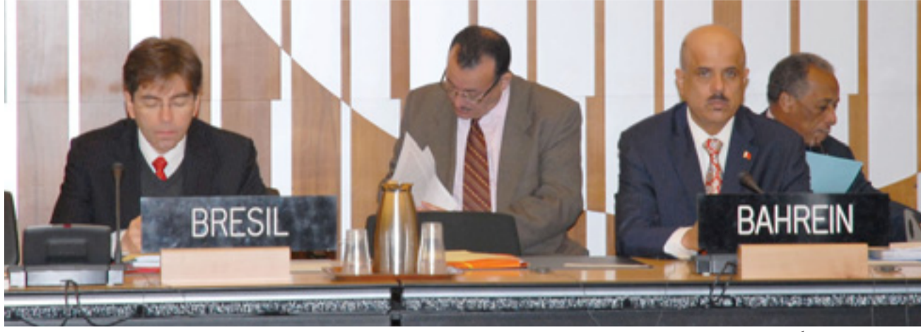
• وزير التربية مشاركاً في دورة مجلس مكتب التربية الدولي

2012، والمتضمن توفير الدعم الفني في مجال التربية للمواطنة والتربية على حقوق الإنسان، بما ساعد الوزارة على تعزيز القدرات الوطنية في مجال تصميم مناهج حقوق الإنسان وتربية المواطنة. هذا، وتتواصل اجتماعات المجلس في اليومين المقبلين لمناقشة وإقرار البرامج والأنشطة للمرحلة القادمة والخطوات المطلوبة لتحويل المكتب إلى مركز امتياز دولي لتطوير المناهج الدراسية بأبعادها كافة باعتبارها رئيسية في أي تطوير للتعليم.