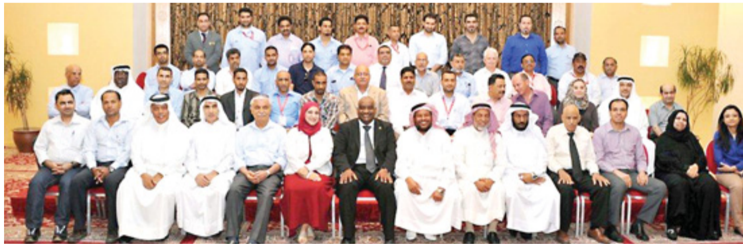
• صورة جماعية لقدامى الموظفين خلال حفل التكريم

الشركة وازدهارها التواصل مكانتها المرموقة كأحد الصروح الصناعية العريقة محلياً إقليمياً وعالمياً. وأكد في كلمته على التزام شركة "بابكو" بتكريم موظفيها وتقدير عطائهم المتواصل في خدمة أهدافها انطلاقاً من إيمانها الراسخ بأهمية العنصر البشري ودوره المحوري في نجاح الشركة ورفقيها حسب الغايات المرجوة. وفي ختام الحفل تم توزيع شهادات التقدير على الموظفين المكرمين.