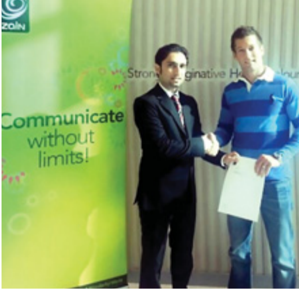
• أحد الفائزين باسترداد مبالغ الفواتير

بادرت زين البحرين مجدداً بالإعلان عن مكافآت جديدة ومغرية لعملائها عند الدفع في الموعد المحدد وذلك باستخدام إحدى القنوات الإلكترونية لدى الشركة حيث يمكنهم الفوز بفرصة استرجاع مبلغ الفاتورة من شهر إلى 12 شهر، بالإضافة إلى الكثير من الجوائز القيمة عند الاستمرار في دفع فواتيرهم في مواعيدها.