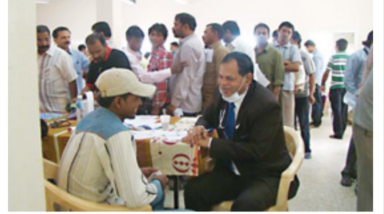
• موظفي أسري خلال الفحص الطبي

كجزء من مسؤولية الشركة العربية لبناء وإصلاح السفن (أسري) الاجتماعية ودعم المشاريع التي تنفذها مؤسسات المجتمع المدني، شاركت الدائرة الطبية بالشركة من خلال المركز الطبي عبر عدد من أطبائه وممرضيه في المخيم الطبي التي نظمتها جمعية الفن من أجل الحياة . وقد شارك أطباء وممرضو وموظفو الدائرة بكثافة في المخيم الطبي المجاني والذي أقيم يوم على الجمعة نهاية مارس، بالتعاون مع جمعية الفن من أجل الحياة، حيث تم فحص أكثر من 175 موظفا وزائرا في ضغط الدم ومرض السكري، وسوف يتابع المركز الموظفين من المصابين بالأمراض المزمنة والعمل على تثقيفهم صحياً للسيطرة على الأمراض المزمنة.