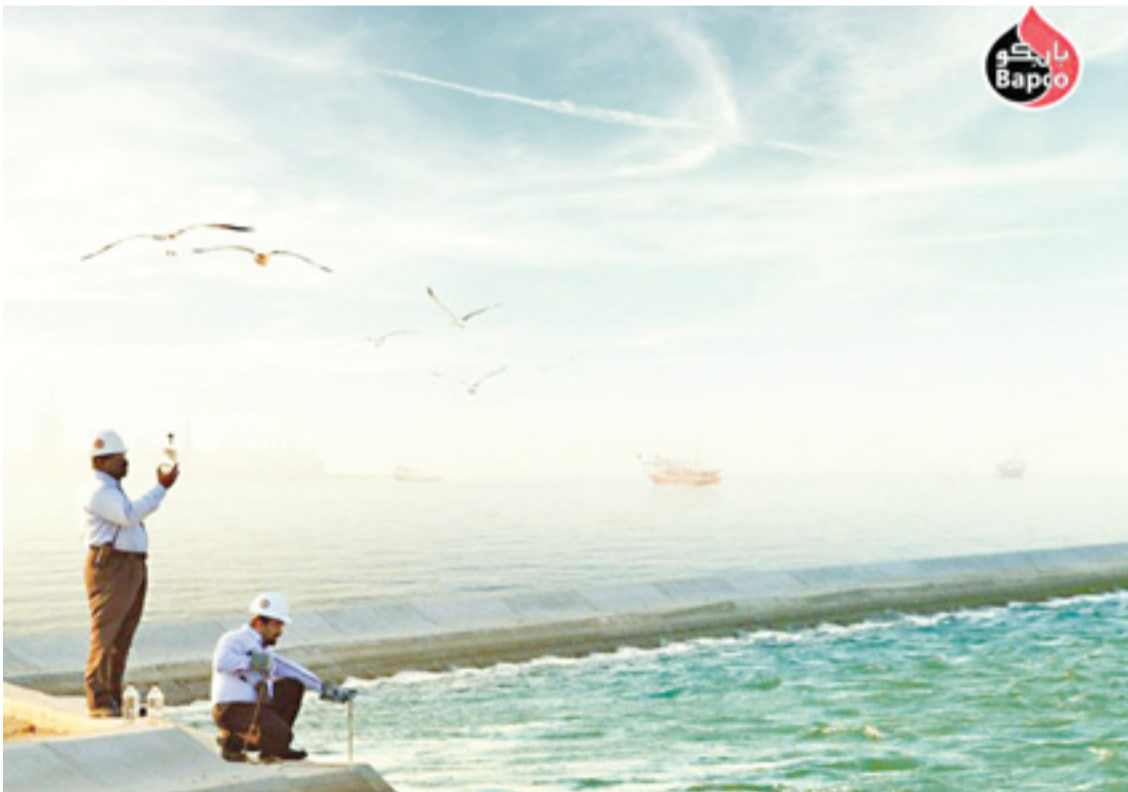
• اخصائي الشركة خلال التدقيق البيئي

بابكو ببذل قصارى جهدها بغية تحسين اداؤها البيئي من خلال إطلاق مشاريع جوهريّة طموحة تسهم بشكل رئيسي في تحسين الأداء البيئي وفق توجهات وتطلعات مملكة البحرين وحسب المستويات العالمية المنشودة.