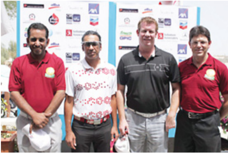
• فريق ألبا المشارك في البطولة

وأضاف استير نهوزين: ”تأتي مشاركة ألبا في دعم هذا المهرجان في إطار حرصها المستمر على دعم مختلف الفعاليات والبطولات الرياضية التي تقام في مملكة البحرين والتي تسهم في تعزيز مكانتها على خريطة الرياضة العالمية، إضافة إلى مسؤولية الشركة الاجتماعية في نشر وتعميق الثقافة الرياضية في المملكة“.