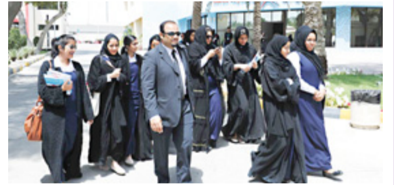
• الطالبات خلال جولتهن في الجامعة

استقبلت كلية البحرين التقنية (بوليتكنك البحرين) مجموعة من طالبات الصف الثالث الثانوي (توجيهي) بمدرسة الرفاع الغربي الثانوية للبنات، وذلك في زيارة تهدف إلى التعرف على البرامج الأكاديمية التي تقدمها البوليتكنك وشروط التسجيل والقبول فيها.