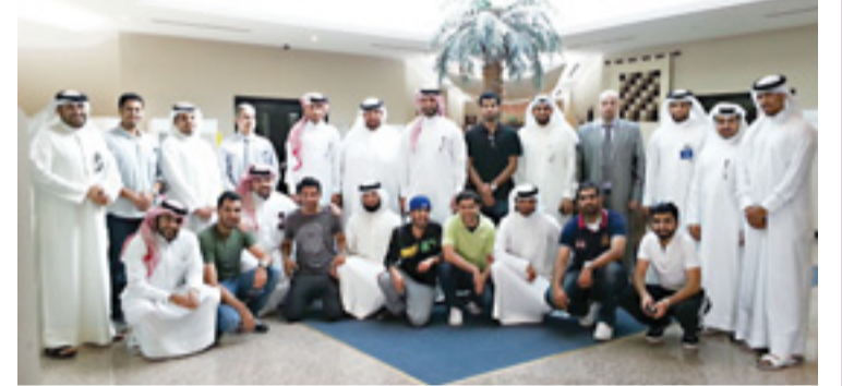
• موظفو المساحة خلال برنامج التدريب

قام موظفو جهاز المساحة والتسجيل العقاري المشاركون في ”برنامج تنمية وإعداد رواد الأعمال“ الذي تنظمه مجموعة بنك البحرين للتنمية من خلال معهد البحرين لريادة الأعمال والتكنولوجيا التابع للمجموعة، بزيارة تعريفية لمركز البحرين لتنمية الصناعات الناشئة (حاضنات الأعمال) التابع للمجموعة أيضاً. حيث هدفت هذه الزيارة إلى الاطلاع على طبيعة خدمات احتضان المشاريع الصغيرة والجديدة التي يقدمها المركز، وكجزء من الجانب التدريبي العملي لبرنامج تنمية وإعداد رواد الأعمال الذي يعقد بشكل دوري ويتركز على العناصر الأساسية في تأسيس المشاريع الصغيرة والمتوسطة وتطوير قدرات الشباب في هذا المجال، مثل معرفة الإجراءات والمتطلبات الخاصة بالأنشطة التجارية والصناعية وإعداد خطة العمل واعداد الميزانية وضبط الحسابات والإمكانيات التجارية. اطلع المتدربون على تجارب بعض رواد الأعمال الملتحقين بالمركز وكيف بدأوا أعمالهم الخاصة ومدى استفادتهم من الخدمات التي يقدمها لهم مركز البحرين لتنمية الصناعات الناشئة والتي تضم توفير وحدات احتضان (ورشة أو مكتب) مختلفة الأحجام لإقامة المشروع، إلى جانب خدمات استشارية ومحاسبية ومكتبية وخدمات متابعة يومية وربط المشاريع المتواجدة بالمركز بالخدمات التمويلية وخدمات الدعم التي تقدمها مجموعة بنك البحرين للتنمية ومؤسسات أخرى.