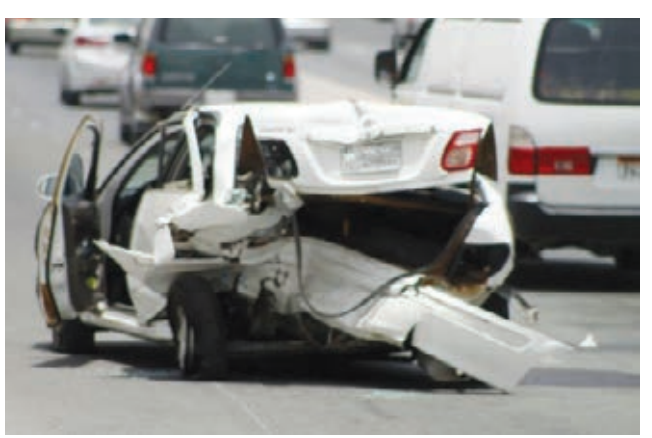
○ السيارتان عقب التصادم.