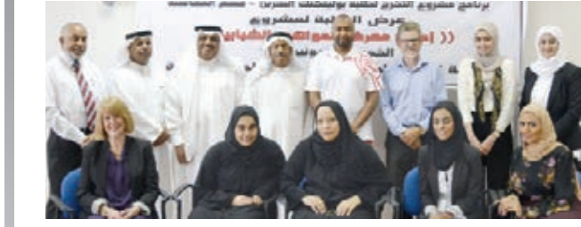
○ المشاركون في احتفالية عرض مشروعات التخرج بقسم المحاسبة.

على تمويل مالي يمكنهم من تنفيذ المشروع على أرض الواقع، كما تم التعرف على أنواع التكاليف وحسابها وأخذها بعين الاعتبار عند اتخاذ الجمعية قرارا لتنفيذ المشروع. ويهدف المشروع الذي قام بدراسة تنفيذه طلبة من قسم المحاسبة إلى الاستفادة من المواهب الشبابية، والعقول المتميزة بالمراكز الشبابية والجامعات والأندية، واستثمار ابتكارات الشباب الموهوبين، وتحويلها إلى مشروعات إنتاجية تسهم في تحقيق النهضة التنموية الشاملة وتوابعها الاقتصادية منها. أكد الدكتور العوهلي في كلمة ألقاها بالمناسبة أن الإنجازات التي حققتها الجامعة طوال الفترة السابقة، سواء تخريج ٢٣٢ طالبا وطالبة، بينهم ١١٦ طالبا وطالبة من كلية الدراسات العليا و ٢١٦ طالبا وطالبة من كلية الطب والعلوم الطبية، وبناء شراكات عالمية مع أشهر الجامعات والشركات اليابانية، وغيرها عشرات الإنجازات، يعود فضلها إلى أسرة الجامعة من الأكاديميين والإداريين، مؤكدا أن هذا الفضل يمتد لكل الزملاء