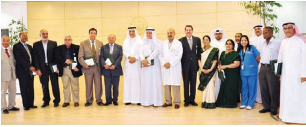
○ جانب من الاحتفالية.

أقامت جامعة بوليتكنك البحرين احتفالية عرض مشروع التخرج لطلبتها في قسم المحاسبة، والذي جاء تحت عنوان «إعداد المواهب الشبابية»، وذلك بقاعة المركز الوطني لدعم المنظمات الأهلية التابع لوزارة التنمية الاجتماعية وبحضور عدد من أعضاء مجلس إدارة جمعية المحرق الأهلية، وعدد من مسؤولي الجامعة. واشتملت الاحتفالية على عرض مشروع (معرض المواهب الشبابية) حيث تمكن الطلبة من إنجاز دراسة المشروع خلال ثلاثة أشهر، وأظهروا قدرة عالية من التميز والابتكار في خطة آلية تنفيذ، وجاء متفهما لحاجة المجتمع المحلي، خاصة أن فترة التدريب لإعداد الدراسة تم انقضائها في مقر جمعية المحرق الأهلية. واشتملت مرحلة التدريب على زيارات ميدانية لعدد من الشركات والبنوك والمؤسسات الأهلية والخاصة، بغية الحصول