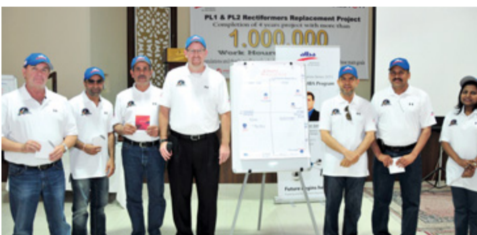
• عدد من المدراء خلال مشاركتهم في البرنامج

في الباء، حيث تهدف إلى ترسيخ ثقافة التعليم في مختلف دوائر وأقسام الشركة، وتغطي مجموعة واسعة من المجالات كالإدارة، والمحاسبة، والموارد المالية، وتقنية المعلومات وغيرها المزيد.