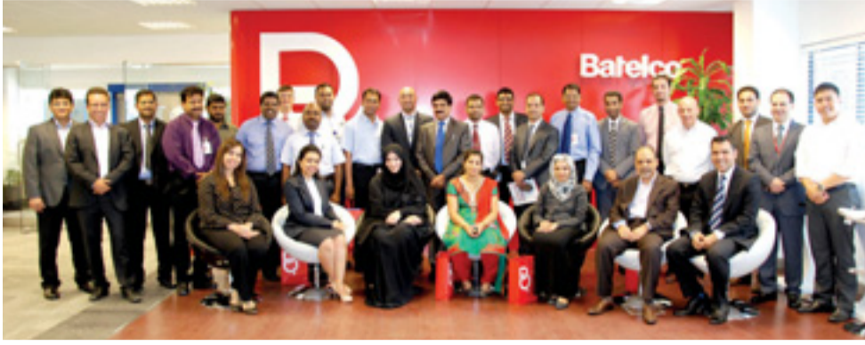
• حضور الورشة

ضمن دعمها للمبادرات الصحية، نظمت بتلكو مؤخراً ورشة عمل خاصة بالقطاع الطبي في البحرين. فقد قام مدير عام وحدة الخدمات التجارية بدعوة 25 من زبائن المؤسسات في القطاع الطبي لزيارة مقر بتلكو الرئيسي في المهمل، حيث قاموا بجولة في مركز بتلكو لخبرات الزبائن ومركز أفكار بتلكو. وخلال الزيارة، قامت إدارة بتلكو باستعراض الدور الذي يمكن أن تلعبه تقنية الاتصالات في مساعدة مؤسسات العناية الطبية في التغلب على الصعوبات اليومية التي تواجهها والمضي قدماً نحو المستقبل من حيث الخدمات الصحية، وذلك عبر تقديم حلول متطورة خاصة بالقطاع الطبي؛ مثل أنظمة اتصالات موقع العناية وتقنية تحديد مواقع المعدات لمتابعة الأصول والموظفين والمرضى.