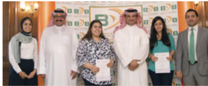
• الموظفات قبل سفرهن للدراسة

بتطوير المهارات الشخصية لدى موظفينا أولاً، وثانياً حتى نتمكن من طرح المزيد من البرامج المتخصصة والحيوية التي تصب أهدافها في تعزيز مفهوم الاعتماد على الذات والتطلع نحو العمل الحر وريادة الأعمال، وذلك من خلال وجود فريق متكامل يمتلك القدرة على إفادة الآخرين وتقديم الاستشارات اللازمة لمختلف شرائح والفئات، مع التركيز على دعم وتمكين المرأة البحرينية بشكل خاص وإتاحة المجال لها لتحقيق أكبر قدر من الاستفادة المنشودة.