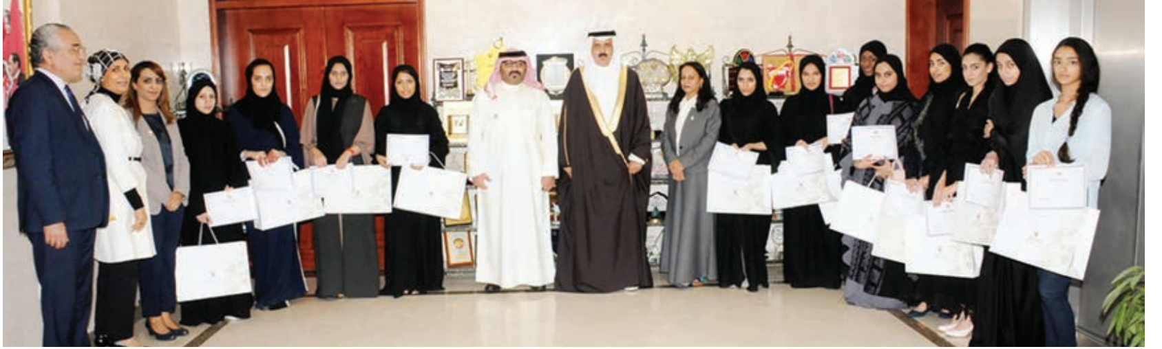
○ خلال استقبال خريجات مشروع تدريس اللغة الفرنسية.

لو أن قاتل النائية البريطانية مسلماً.. لقام الإعدام الأجنبي باتهام جميع المسلمين.. لو أن من أيد ورحب بقتل الأمريكان «العتليين» في أحد الملاهي، وتمنى لو أن كل من في المهلي قتلوا، كما فعل ذلك أحد مسؤولي الكنيسة في أمريكا، لو كان هذا الشخص مسلماً أو إماماً لمسجد لسارت أمريكا بسجنه وتطبيق القانون عليه، ولم تعتبر ما قاله من باب حرية الرأي والتعبير والممارسة السلمية.. إنها الإزدواجية الأجنبية التي لا تطبق إلا على الإسلام والمسلمين.