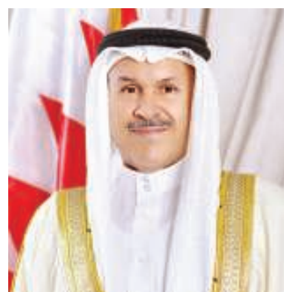
محافظ محافظة العاصمة

لمسيرة التعليم في المملكة من أجل بناء مستقبل أكثر ازدهاراً للأجيال القادمة. وأوضح أن أوامر وتوجيهات سموه لمتابعة الدفاع لبذل مزيد من الجهود لمتابعة جميع احتياجات المواطنين والمقيمين على هذه الأرض الطيبة عن كثب، من خلال رصد طلبات الأهالي والعمل على تحقيقها وسد النواقص عبر التواصل مع الجهات المعنية والمتابعة المستمرة معها لضمان توفير حياة كريمة لهم، اقتداءً بمنهاج سموه بالاقتراب من المواطنين وتلمس حاجاتهم عن قرب.