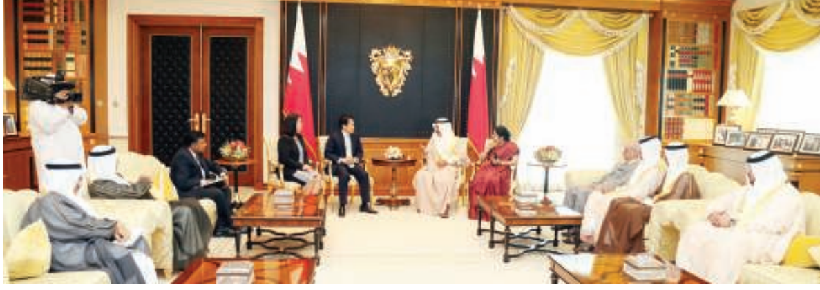
صاحب السمو الملكي رئيس الوزراء لدى استقباله عدداً من السفراء

يضمن كامل حقوقهم وفقاً للقوانين الوطنية والاتفاقيات الدولية، بدور هذه الجاليات وإسهامها في خطط ومشاريع البناء والتنمية التي تشهدها المملكة في مختلف المجالات. من جانبهم، أعرب السفير التايلندي والقائمة بأعمال السفارة الفلبينية والقائمة بأعمال السفارة الهندية، عن خالص شكرهم وتقديرهم للبحرين والحكومة برئاسة صاحب السمو الملكي رئيس الوزراء على دعمهم ومساندتهم لجاليات وعمال بلدانهم المقيمين في البحرين وما يحظون به من تسهيلات من كافة وزارات ومؤسسات الدولة، وما تتمتع به البحرين من تطور وقوانين مرنة تعمل البحرين دائماً على تحديثها مواكبة للمتغيرات في ضوء وحجم وتنوع مصادر العمالة التي تستضيفها البحرين والتي ضمنت لهذه العمالة كامل الحقوق.