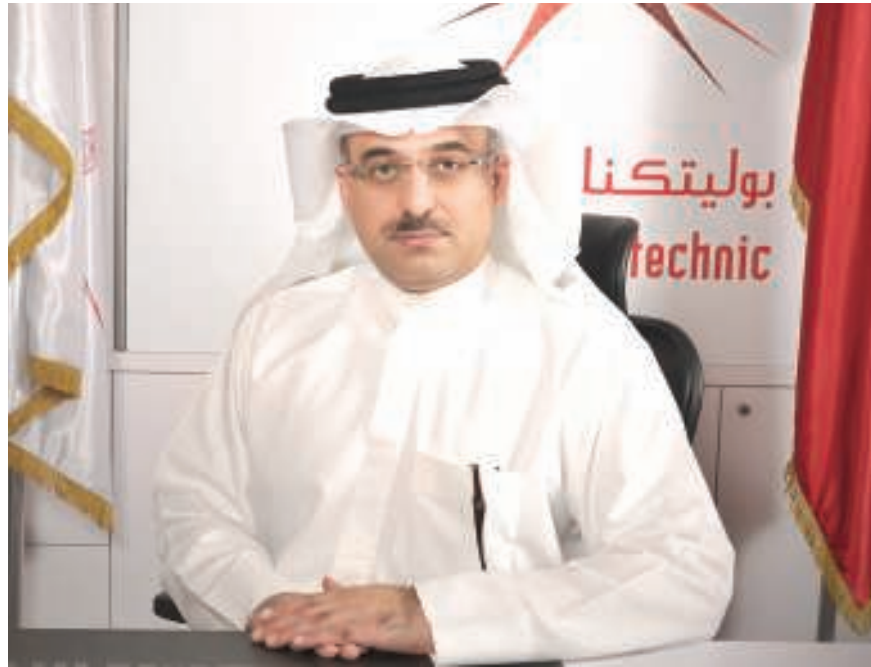
القائم بأعمال الرئيس التنفيذي لـ بوليتكنك البحرين، د.محمد العسيري

هذا وتقوم بوليتكنك البحرين بمراجعات ذاتية لبرامجها كافة، وذلك بالتعاون مع أكثر من 32 مؤسسة تعليم عال وشركات متخصصة ومراكز علمية من مختلف دول العالم. وقد نتج عن تلك المراجعات الحصول على تقارير دقيقة تتضمن مجموعة من التوصيات