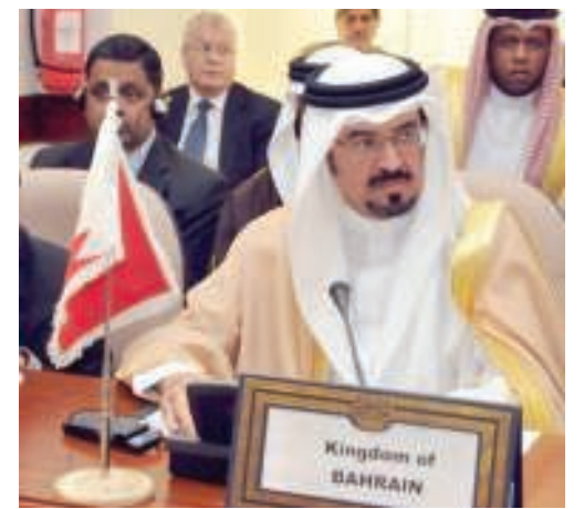
الشيخ حمود بن عبدالله آل خليفة في الاجتماع

أدان البيان الختامي لاجتماع اللجنة التنفيذية بمنظمة التعاون الإسلامي بأشد العبارات استهداف ميليشيات الحوثي - صالح ومن يقف وراءها من بعض الدول الإقليمية لمكة المكرمة بوصفه اعتداء على حرمة الأماكن المقدسة واستفزازاً لمشاعر المسلمين في العالم. وأكد البيان، الصادر عن الاجتماع المنعقد بمقر المنظمة في جدة