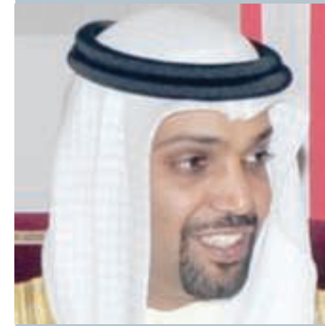
الشيخ سلمان بن خليفة آل خليفة