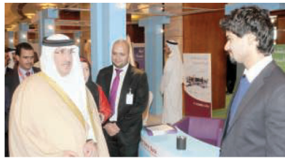
الشيخ محمد بن عيسى آل خليفة يزور جناح البنك

إلى تعريف الجمهور ببرامج الدعم التي تقدمها تمكين بالتعاون مع المؤسسات الممولة من خلال مشاركة عدد من رواد الأعمال المستفيدين من هذه البرامج» واختتم السيد محمد إبراهيم تصريحه قائلاً: «سعدنا