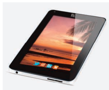
الهاتف اللوحي HCL

أمامية مدمجة لمكالمات الفيديو. كما تم تزويد الجهاز بمعالج رسومي قوي وذاكرة عشوائية (رام) DDR3 سعة 1 جيجا بايت لتسمح للمستخدمين التمتع بألعاب الرسوم البينائية ثنائية وثلاثية الأبعاد ببساطة. ويحتوي الجهاز اللوحي على ذاكرة داخلية لتخزين جميع الأفلام والصور والألعاب المفضلة والقابلة أيضاً للزيادة عبر منفذ «مايكرو إس دي» لتستوعب ساعات تخزين حتى 32 جيجا بايت، ويأتي الجهاز مزوداً بشكل مسبق بتطبيق Thinkfree Office، والذي يمكن المستخدمين من إنشاء مستندات ومفتحة وتعديلها أثناء النقل.