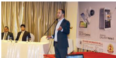
خلال الدورة التدريبية

المطروحة من قبل الحضور، واختتمت الندوة بطرح الأسئلة على الحضور وتقديم عدد من الأجهزة القيمة كهدايا لهم. وقال مدير تسويق شركة بن هندي إنفوماتكس على الجبيري «تقدم سامسونج في الآونة الأخيرة عدداً كبيراً جداً من أجهزة الهواتف النقالة الذكية والمتطورة وكذلك التاب والكاميرات، والتي تلقي نجاحاً منقطع النظير يشقى أنحاء العالم، ويدورنا فائداً نسعى من خلال تلك الأدوات التواصل المستمر مع زبائننا وتعرفهم بكل ما هو جديد من منتجات سامسونج من الهواتف النقالة».