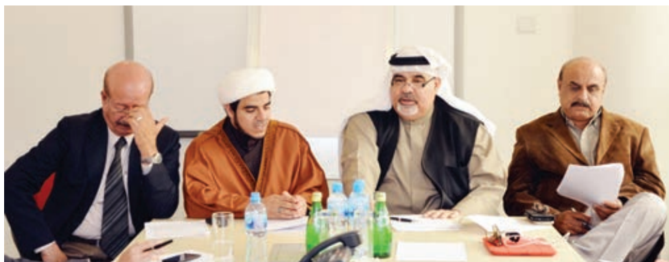
لقاء مجموعة البحرين لحقوق الإنسان.

جدير بالذكر أن أعضاء فريق شباب بتلكو للتسويق كانوا قد عقدوا منتدى بتلكو للتسويق في الجامعة الأهلية وبحرين بوليكنيك، ويخطون الآن لعقد المزيد من الجلسات التعليمية لتلبية الطلب على هذا البرنامج، واستجابة لردود فعل