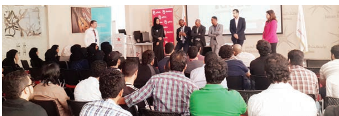
ممثلو بتلكو مع الطلبة.

جدير بالذكر أن أعضاء فريق شباب بتلكو للتسويق كانوا قد عقدوا منتدى بتلكو للتسويق في الجامعة الأهلية وبحرين بوليكنيك، ويخطون الآن لعقد المزيد من الجلسات التعليمية لتلبية الطلب على هذا البرنامج، واستجابة لردود فعل