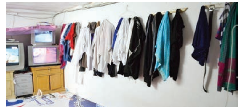
بعض المخالفات التي رصدت بمرفق المدرسة.