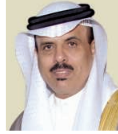
د. ماجد النعيمي

التدريبات. وخلص استطلاع نفذته الوزارة حول تطبيق الاستراتيجية العددية، وشمل عينة عشوائية من أولياء الأمور، إلى أن 91.8% من أولياء الأمور أقرّوا بدور الاستراتيجية الإيجابية في تعلم أبنائهم الرياضيات. وأضاف البيان أن الجهات المختصة تراعي هذه النتيجة عند تقييم اختبارات الطلبة، علماً أن أسئلة الامتحانات لم تكن غامضة، ووضعت وفق كفايات المنهج ومخرجاته، وكانت شاملة ومتنوعة ومن صلب المنهج، وبنفس العمق وطريقة التدريس، وراعت الفروق الفردية بين الطلبة، وتم توزيع عينات للاختبار الشفوي «الذهني» والتحريري للصفوف من الثالث حتى السادس لإطلاع المعلمين والطلبة عليها، وليتسنى للطلبة التدريب عليها والتعرف على طبيعتها. ولفت إلى أن الامتحان ينقسم إلى جزء شفوي «ذهني» وآخر تحريري، وخصص وقت مناسب للإجابة عن كل منهما، مع إعطاء فترة راحة للطلبة بين الامتحانين، ولم يطغ زمن الامتحان الذهني على التحريري، إذ تم وضع الامتحانين وفقاً لمعايير محددة، وبالنسبة لعدم وجود كتاب للمادة، وفرت