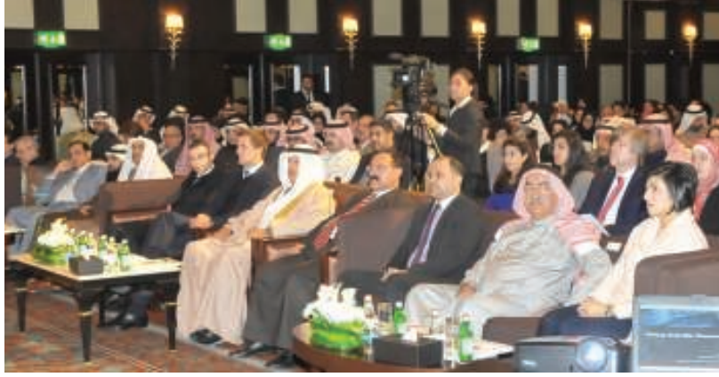
جانبا من الحضور

وقدم البروفيسور يان ريكز، أحد المتخصصين العالميين في مجال عمل الأبحاث ونشرها واستخدامها من أجل تطوير أداء مختلف مؤسسات القطاع العام والخاص والابتكار التنظيمي، محاضرة تحت عنوان «تشجيع البحث والتطوير في مؤسسات التعليم العالي لبناء اقتصاد قائم على المعرفة»، ركزت على الطرق العلمية والمنهجية الصحيحة لعمل أبحاث تخدم الأهداف المنشودة للمؤسسات. نظمت الندوة «كربو» للحلول المبتكرة، وحضرها محافظ العاصمة الشيخ هشام بن عبدالرحمن آل خليفة، وعدد من المهتمين والأكاديميين والفنيين.