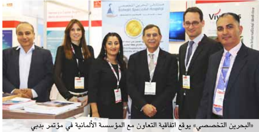
«البحرين التخصصي» توقع اتفاقية التعاون مع المؤسسة الألمانية في مؤتمر دبي

إن مستشفى البحرين التخصصي أول مستشفى في البحرين ينال اعتماد اللجنة الدولية المشتركة الأمريكية، وهذا الاعتماد يعتبر من أعلى المعايير الرائدة في قياس جودة الخدمات الصحية في جميع أنحاء العالم. كما أشاد عرذاتي بأهمية التعاون بين مؤسسة ومستشفيات «فيفانتس» الطبية ومستشفى البحرين التخصصي لبلوغ أعلى مستويات جودة الرعاية الصحية المقدمة لمرضىنا والتي تتماشى مع شعار المستشفى... «صحتكم هدفنا».