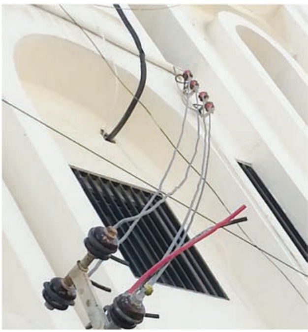
○ التمديدات على النافذة.

وطالب بوعقن من الوزير المشرف على هيئة الكهرباء والماء الاستفادة من الكوادر الوطنية المتميزة وأيضا التشديد على المتقاعسين وغير المبالين والمهندسين موضحا ثقته الكبيرة بالوزير المشرف على الهيئة.