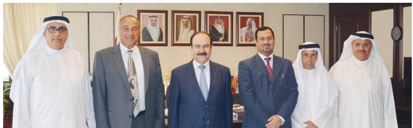
○ خلال الاستقبال.

وتمن رئيس اللجنة الفنية اهتمام الوزير الذي كان له الأثر الإيجابي على حل مشكلة المواطن حيث كانت الأسلاك تستسبب في بظنا محتم لعلها إحدى نوافذه وفي وضع لا يتناسب مع شروط