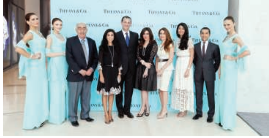
خلال افتتاح البوتيك الجديد

شلمبيرجير. وتعرض في البوتيك أيضاً مجموعات فاخرة مثل مجموعة Victoria المرصعة بماسات قطع الماركيز والقطع المدور تشع وكأنها أزهار فاتنة. فضلاً عن أحدث المجوهرات من Atlas™ الجريئة والجمال المبدع؛ و مفاتيح تيفاني للجمع والارتداء كرمز للفرح والحياة مليئة بالاحتمالات الرائعة. تكرم مبتكرات تيفاني هذه، التي تغلف عند شرائها بعلبة تيفاني الزرقاء، الرمز العالمي للتميز، إرثاً وتقاليد عظيمة تتسم بالثراء والعراقة، جعلت من تيفاني الوجهة الأولى للهدايا من المجوهرات ذات الجمال الخالد، والحلي المنشودة التي تلخص حياة هنية سعيدة.