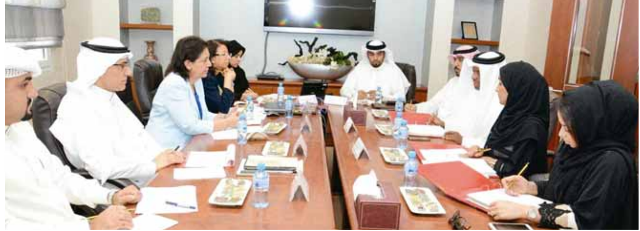
○ ممثلو المجلسين خلال الاجتماع.

الأسري في المجتمع البحريني بدأ من المناهج التعليمية. كما تم بحث تنفيذ توصيات دراسة «أثر تطبيق قانون أحكام الأسرة - القسم الأول - في القضاء الشرعي» التي نفذها المجلس الأعلى للمرأة بالتعاون مع المجلس الأعلى للقضاء والتي أوصت بضرورة الإسراع في إصدار القسم الثاني من قانون الأحكام الأسرية، وضرورة الاهتمام بمقار محاكم القضاء الشرعي والعناية بها، وإنشاء محاكم خاصة للقضايا الأسرية (القضايا الشرعية) مراعية خصوصية المجتمع البحريني.