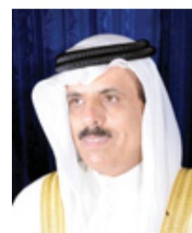
• ماجد النعمي

مدينة عيسى - وزارة التربية والتعليم: عبر وزير التربية والتعليم، رئيس مجلس التعليم العالي ماجد النعمي، عن عظيم شكره وتقديره وامتنانه لرئيس