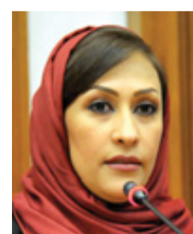
• سوسن تقوي

ثمنت عضو لجنة الشؤون الخارجية والدفاع والأمن الوطني بمجلس النواب سوسن تقوي صدور قرار من رئيس الوزراء صاحب السمو الملكي الأمير خليفة بن سلمان آل خليفة بشأن جدول درجات ورواتب أعضاء