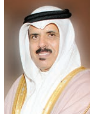
○ وزير التربية.

وبهذه المناسبة أشاد الدكتور ماجد بن علي التميمي وزير التربية والتعليم باستمرار الدعم الكبير الذي تقدمه القيادة للطلبة المتفوقين في المرحلة الثانوية، وتخصيص ميزانية كبيرة للبعثات والمنح المعتمدة لهم على الرغم من تخفيض الميزانية العامة، منوهاً بالزيادة التي تم اعتمادها للبعثات والمنح مقارنة بالأعوام الماضية لاستيعاب جميع المتفوقين.