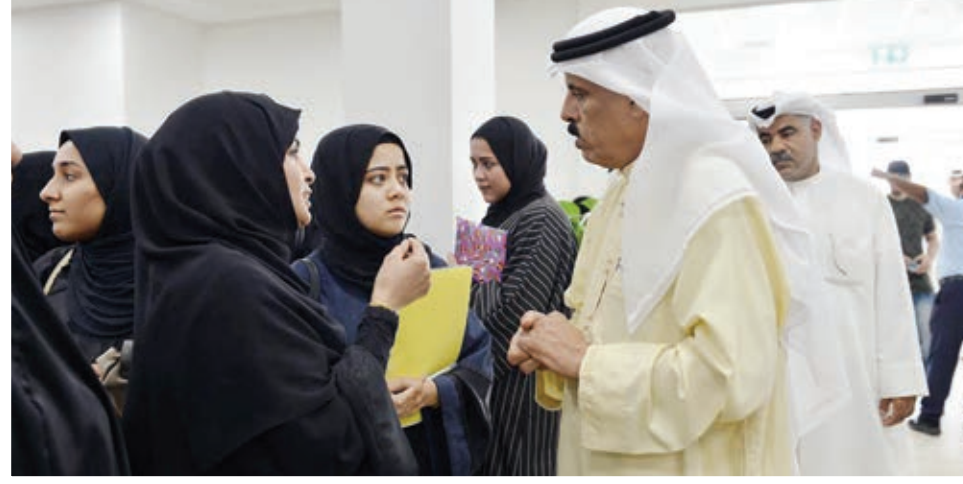
○ وزير التربية يتحدث إلى طالبات مترشحات للبعثات.

وزار الوزير مركز خدمات المراجعين بالوزارة، والتقى بالطلبة المتفوقين وأولياء أمورهم، مشيداً بما أبدوه من حرص على استكمال متطلبات تثقيف البعثات والمنح ومن تنفيذ بالتعليمات والتوجيهات