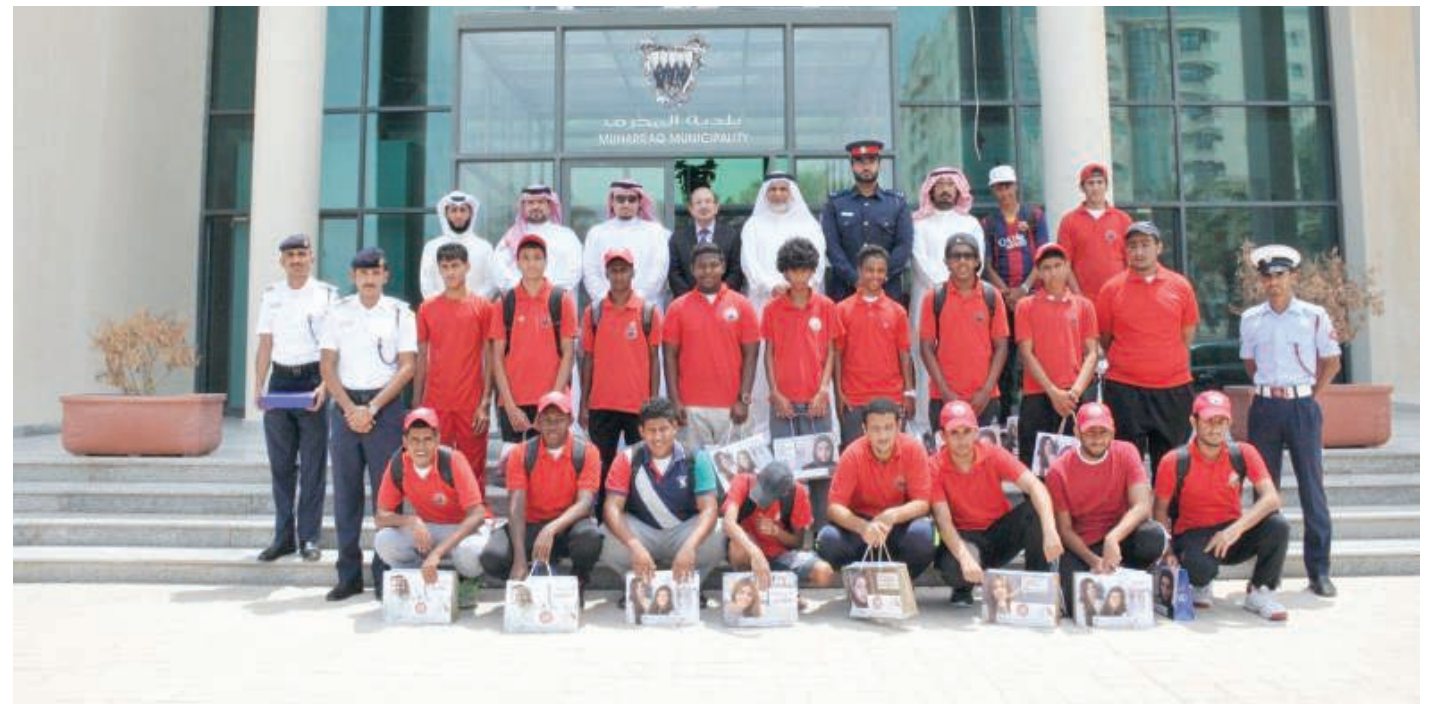
مجلس بلدي المحرق خلال استقباله 20 طالباً من منتسبي المعسكر الصيفي