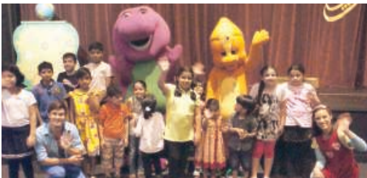
أطفال المؤسسة الخيرية الملكية خلال عرض «بارني حول العالم»

حضر أطفال المؤسسة الخيرية الملكية، أمس، عرض «بارني حول العالم»، بدعوة من هيئة البحرين للثقافة والآثار، واستمتعوا بأجواء من البهجة والسعادة طيلة فترة العرض. وأكدت الهيئة حرصها الدائم بأن تكون الثقافة والبهجة التي تصنعها متاحة لجميع الفئات في المجتمع البحريني، لافتة إلى أن مهرجان صيف البحرين يتوجه إلى فئة الأطفال بالكثير من الفعاليات كالورش التدريبية والتثقيفية، والمقامة كذلك في حديقة نخول بجانب مجمع سترة. وتوفر هيئة البحرين للثقافة والآثار مجموعة من التذاكر المجانية المخصصة لأطفال المراكز الاجتماعية لحضور عروض الأطفال في مهرجان صيف البحرين، من بينها: بيت بتلكو لرعاية الأطفال، ومؤسسة السنايل لرعاية الأيتام وجمعية أولياء أمور المعاقين. ويتواصل مهرجان صيف البحرين حتى 31 الجاري، ويوفر العديد من الفعاليات والأنشطة من خلال حديقة نخول الواقعة بجانب مجمع سترة التجاري، وعروضه الفنية والموسيقية في الصالة الثقافية كعرض شارع السمسم، حفل تيتي روبن، وفرقة أوركسترا ريكغ كرو.