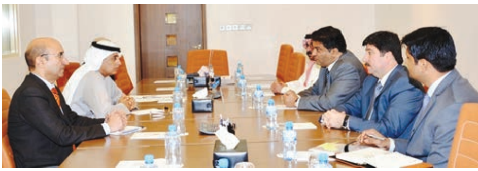
بحث الخطوات العملية لتأسيس مركز تنمية الصادرات