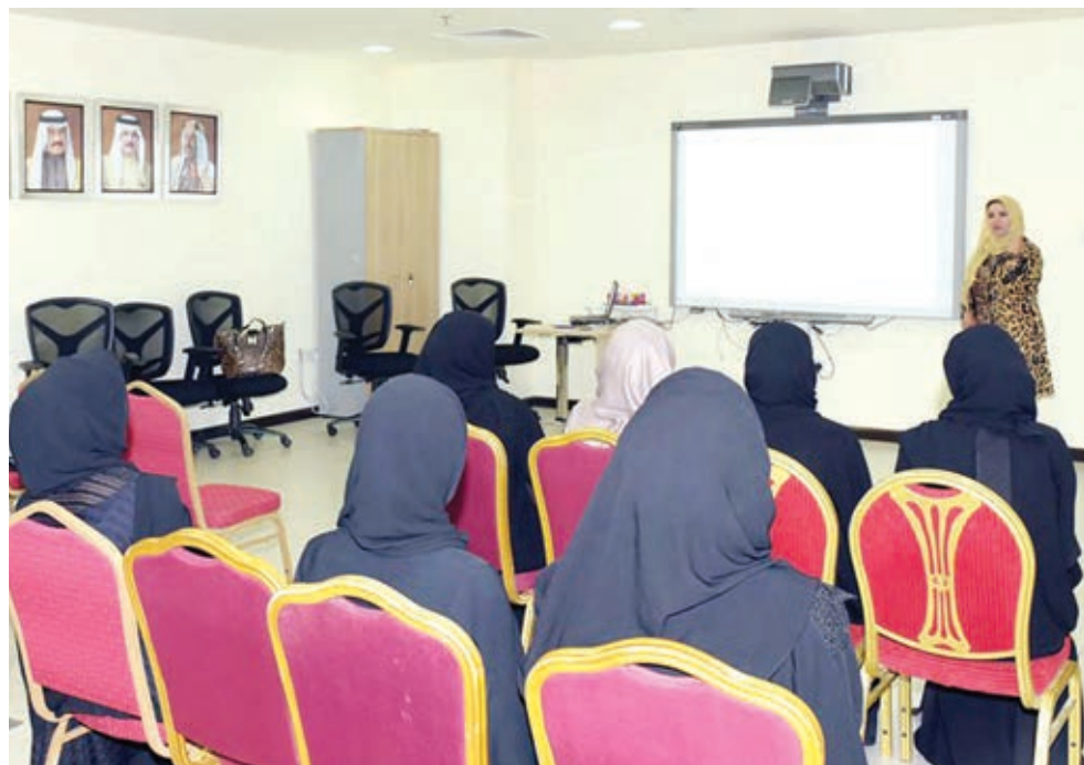
جانب من المشاركات في اللقاء.

كتب: أحمد عبدالحميد ينظم مركز عيسى الثقافي بالتعاون مع الجامعات في البحرين مؤتمراً شبابياً بعنوان «شباب ضد التطرف» يوم الأحد الموافق ٢٩ مايو الجاري، على مدى يومين، والذي يستهدف جمع شباب الجامعات في البحرين لمناقشة ظاهرة التطرف، التي تعتبر من أهم القضايا التي تهم المجتمعات المعاصرة، وفي ظل الأوضاع السياسية التي تشهدها المنطقة، صرح بذلك الشيخ خالد بن خليفة آل خليفة نائب رئيس مجلس الأمناء المدير التنفيذي لمركز عيسى الثقافي. وقال لـ«أخبار الخليج» إن ظاهرة التطرف