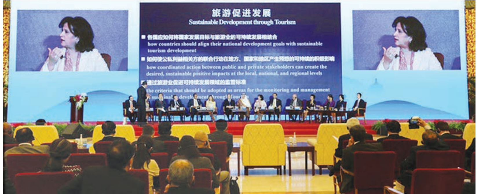
الشيخة مي بنت محمد آل خليفة تتحدث خلال المؤتمر.

كان الإمام محمد عبده مولعاً بجمع أسماء وعناوين المصنفات والكتب المتشابهة.. ونشر مرة في مجلة العروة الوثقى مقالة موسوعة أحصى فيها حوالي ٤٠٠ كتاب من كتب التراث تشترك جميعها في أنها خصصت لنكر محاسن الناس أو الأحوال أو الدول.. الخ؛ وكتب الإمام يوماً كلاماً