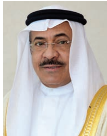
د.الشيخ خالد آل خليفة.

الثقافي العام الماضي، وذلك بهدف مناقشة قضايا الشباب والتحديات التي تواجههم ودورهم في معالجتها، ونشر مفهوم الوسطية والاعتدال وتقبل الآخر واحترام الاختلافات.