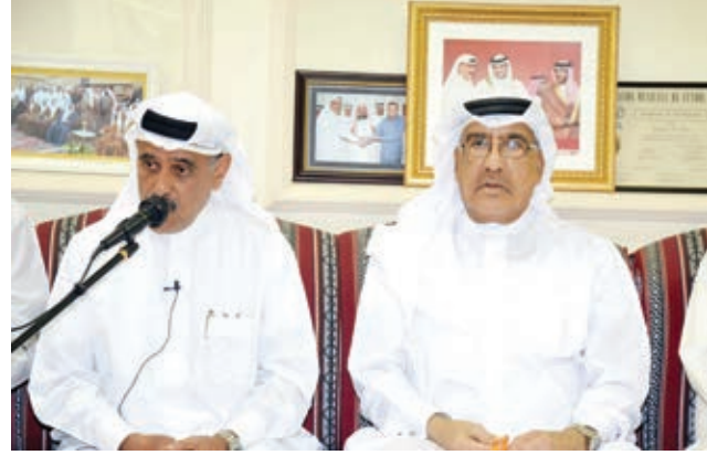
○ جانب من المتحدثين في الندوة.