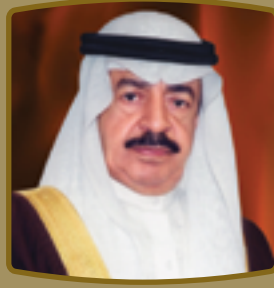
صاحب السمو الملكي الأمير خليفة بن سلمان آل خليفة