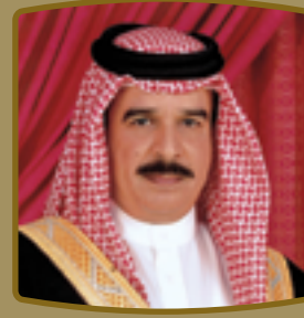
حضرة صاحب الجلالة الملك حمد بن عيسى آل خليفة

H.R.H. Prince Khalifa bin Salman Al Khalifa Prime Minister