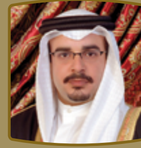
صاحب السمو الملكي الأمير سلمان بن حمد آل خليفة

His Majesty King Hamad bin Isa Al Khalifa King of Bahrain