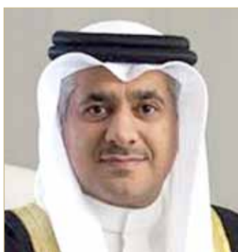
وزير المواصلات والاتصالات

يفتح وزير المواصلات والاتصالات كمال أحمد، اليوم الأحد، المنتدى العلمي "تقنيات الفضاء للبحرين"، الذي تقيمه كلية البحرين التقنية (بوليتكنك البحرين)، بالشراكة مع الهيئة الوطنية لعلوم الفضاء، في قاعة البحرين بحرم البوليتكنك في مدينة عيسى، ويمتد إلى يوم غد الاثنين 12 نوفمبر 2018.