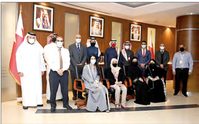
وزير الصناعة والتجارة والسياحة يتوسط فريق الجودة

وبين وزير الصناعة والتجارة والسياحة بأن الوزارة على التزام تام بتطبيق نظام إدارة الجودة (ISO9001:2015) بحسب متطلبات المواصفة الدولية كإحدى السبل الداعمة لمسيرتها في التحسين المستمر، حيث إنها ارتقت في الآونة الأخيرة بعملها على جميع الأصعدة عن طريق تطبيق أفضل الممارسات في مجال الحوكمة، وكذلك التخطيط الفعال لتحقيق الأهداف السنوية لرفع مستوى أدائها والجودة والبحث الدائم عن فرص للتحسين المستمر لضمان كفاءة تقديم الخدمات والحد من احتمالية حدوثها والاستعداد الدائم لمواجهةها، وذلك يأتي تنويحاً للرغبة المستمرة والجهود المتواصلة بالعمل وفقاً للمنهجيات والنظم العالمية التي تعتبر الركيزة الأساسية لتعزيز مهنية وجودة